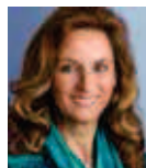
Ulrike Lubek Direktorin des Landschaftsverbandes Rheinland